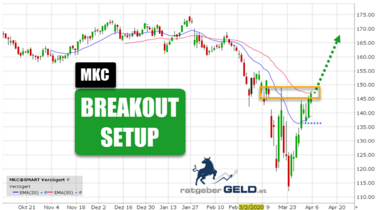
Chart vom 03.04.2020 - Basis täglich, 6 Monate - Kurs: 146.88 USD