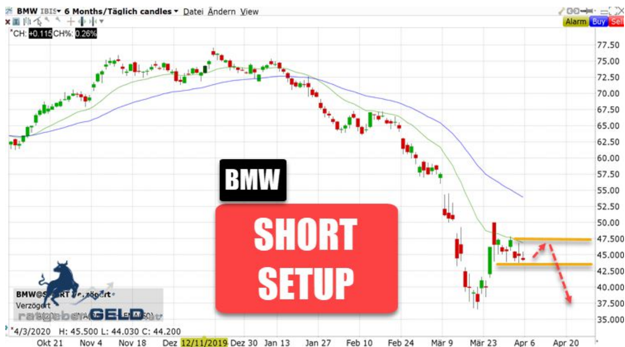
Chart vom 03.04.2020 - Basis täglich, 6 Monate - Kurs: 44.20 EUR