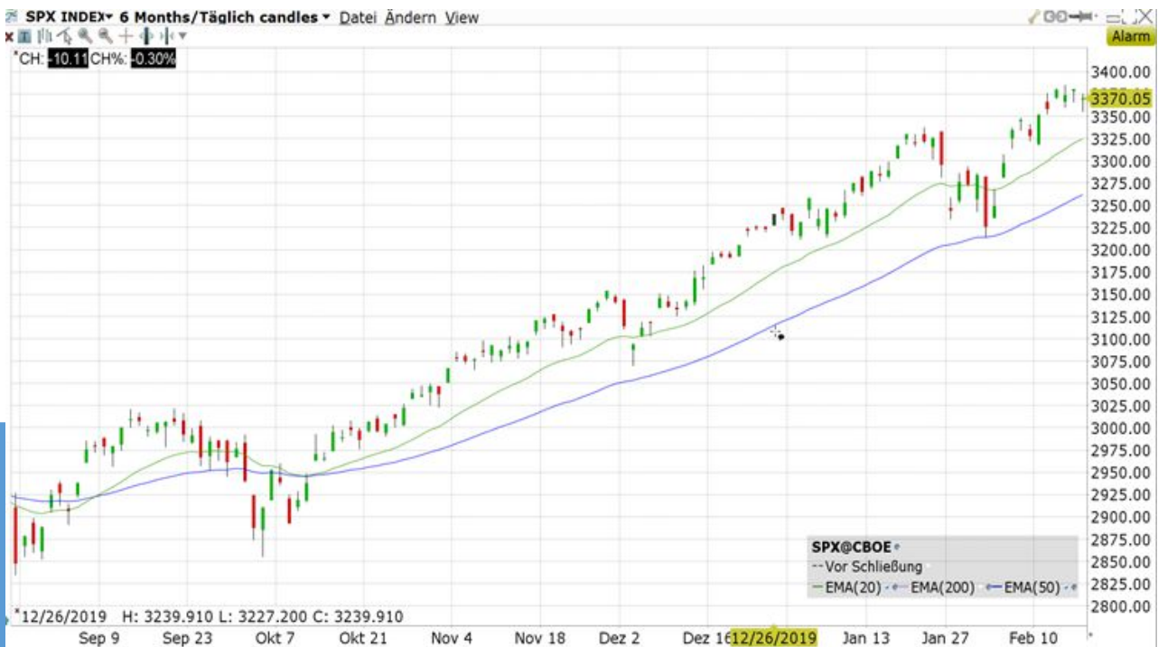
Chart: S&P500 - Basis täglich, 6 Monate - Kurs: 3370.05 - Datum: 18.02.2020