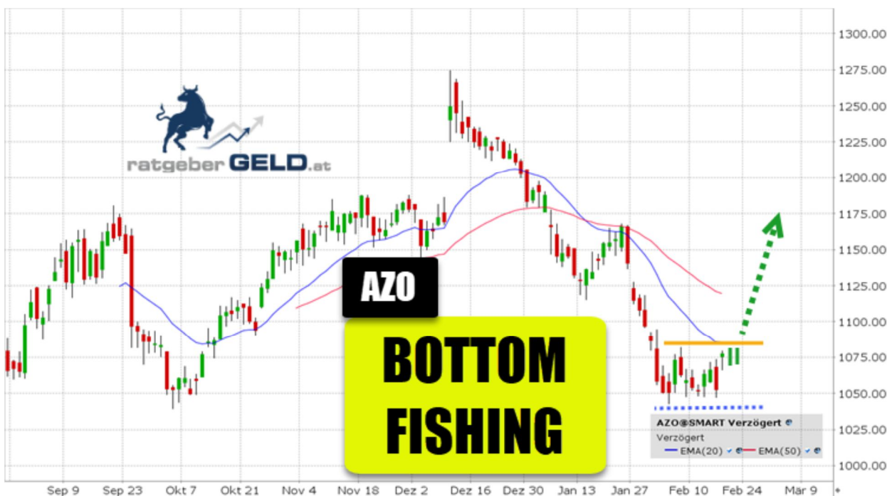
Chart vom 18.02.2020 - Basis täglich, 6 Monate - Kurs: 1075.72 USD