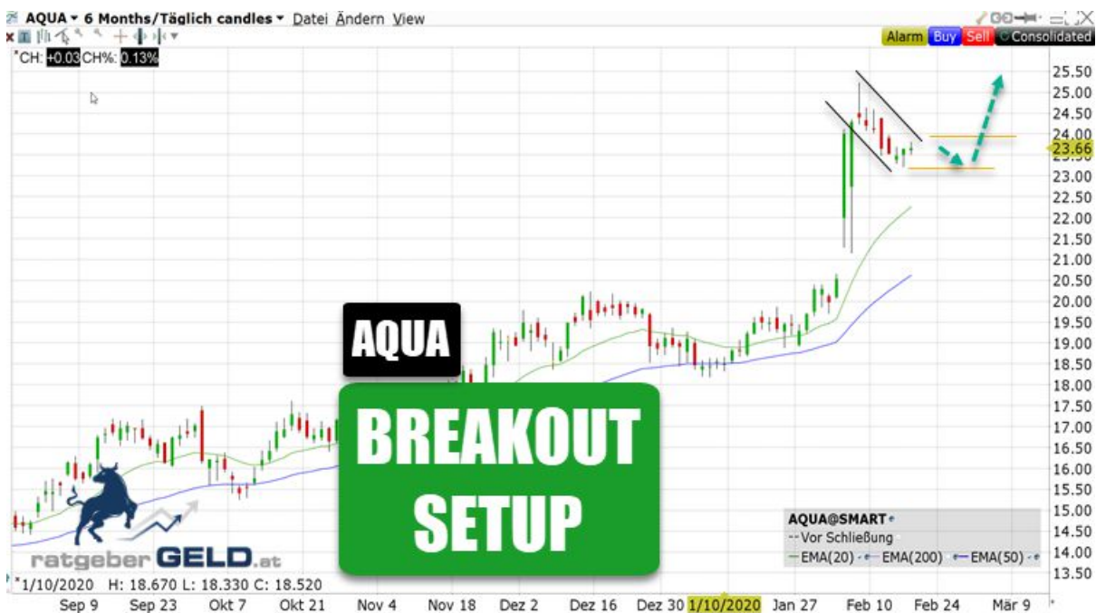
Chart vom 18.02.2020 - Basis täglich, 6 Monate - Kurs: 23.66 USD