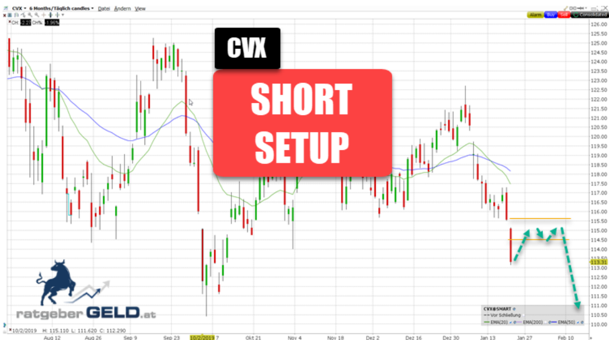
Chart vom 21.01.2020 - Basis 6 Monate - Kurs: 113,31 USD

Minus 8,3 Prozent in den vergangenen sechs Monaten setzen die seit dem Allzeithoch von vor zwei Jahren andauernde Talfahrt fort. Sie sind ein deutliches Zeichen für die Flaute am Ölmarkt. Jetzt gab es noch einmal ein Gap nach unten.