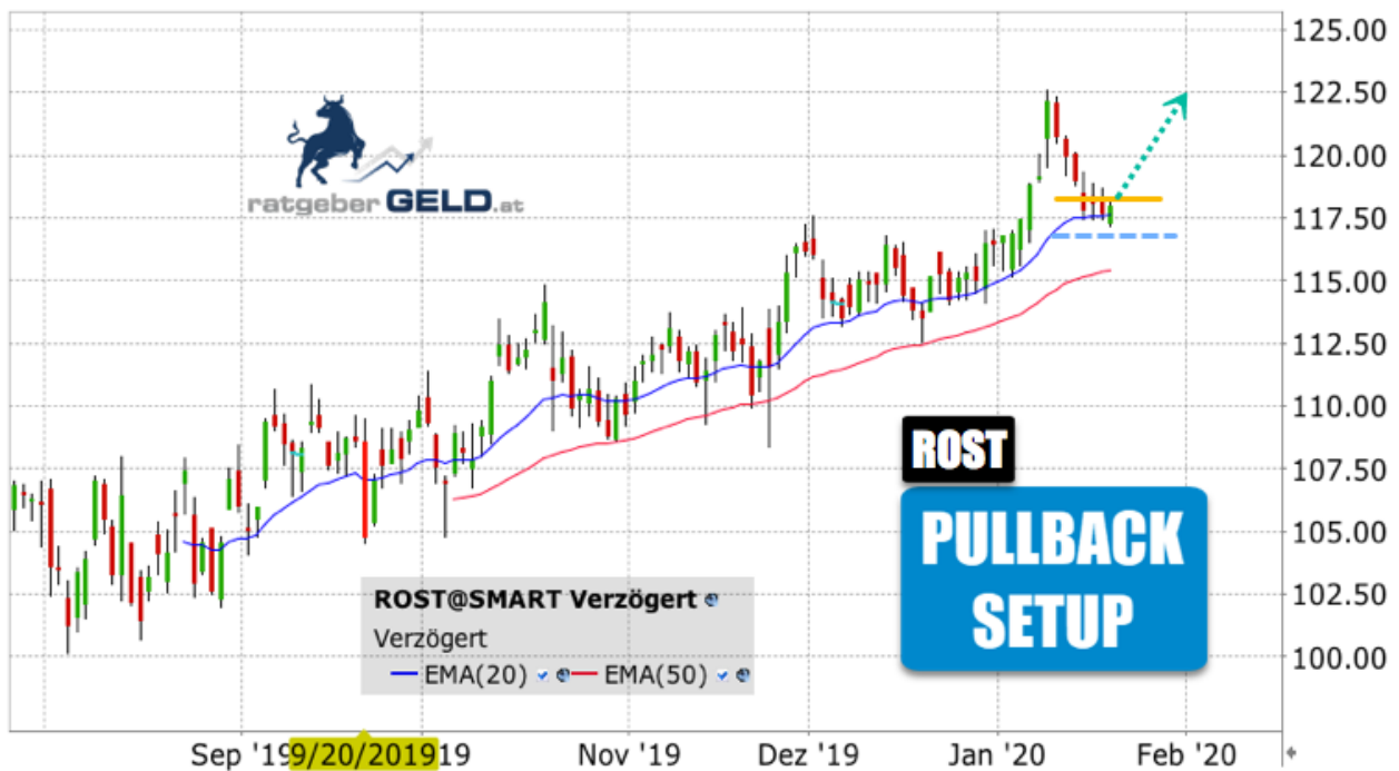
Chart vom 21.01.2020 - Basis täglich, 6 Monate - Kurs: 117,82 USD