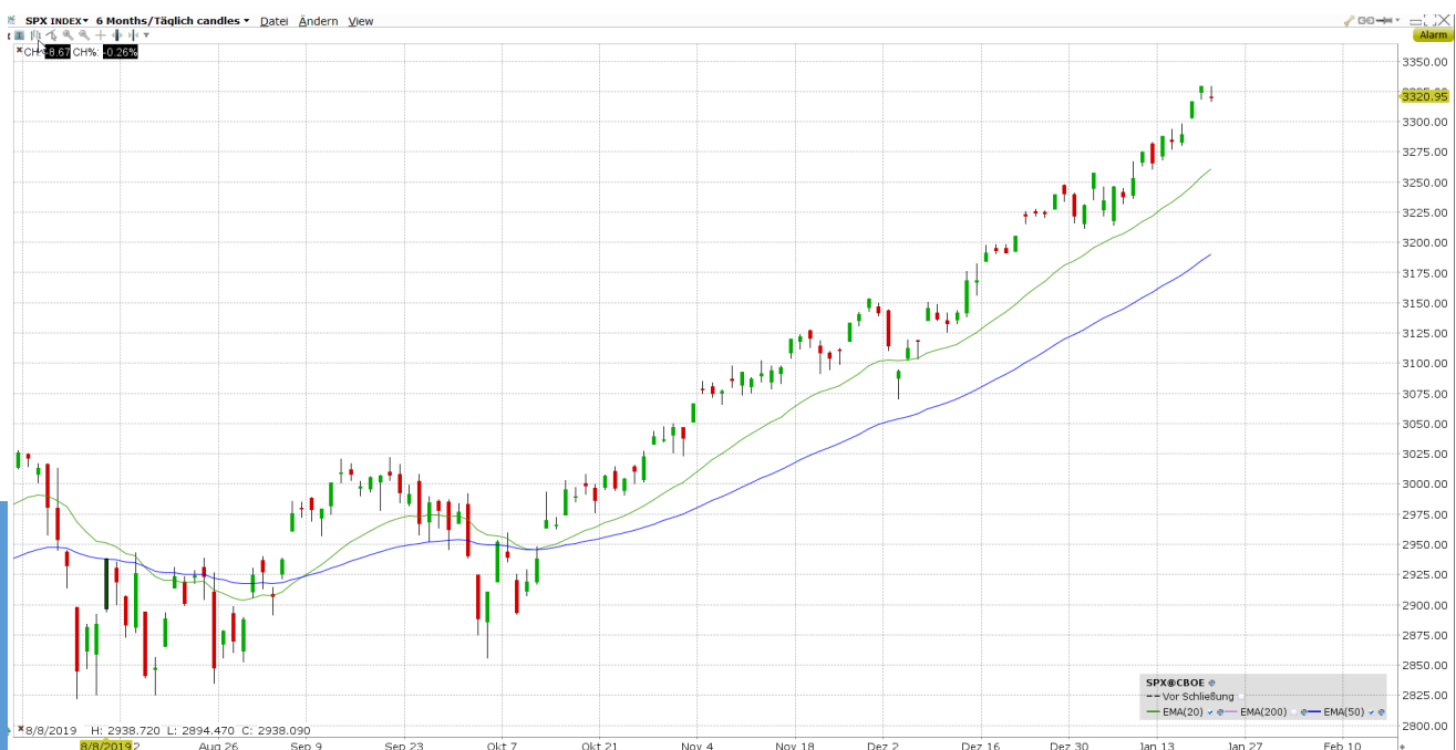
Chart: S&P500 Kurs: 3320,95 Datum: 21.01.2020