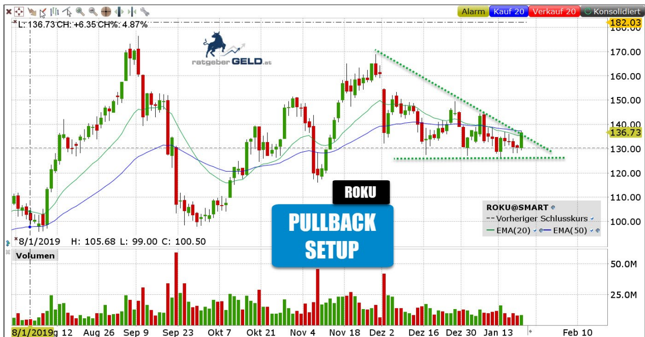
Chart vom 21.01.2020 - Basis 6 Monate - Kurs: 136.37 USD