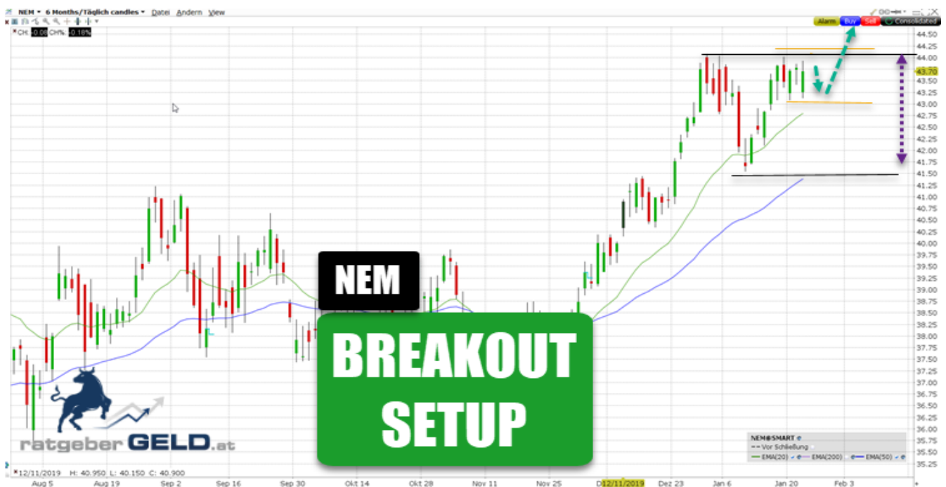
Chart vom 23.01.2020 - Basis 6 Monate - Kurs: 43.70 USD