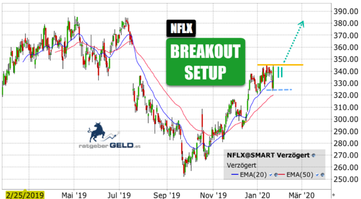
Chart vom 23.01.2020 - Basis täglich, 1 Jahr - Kurs: 343.36 USD