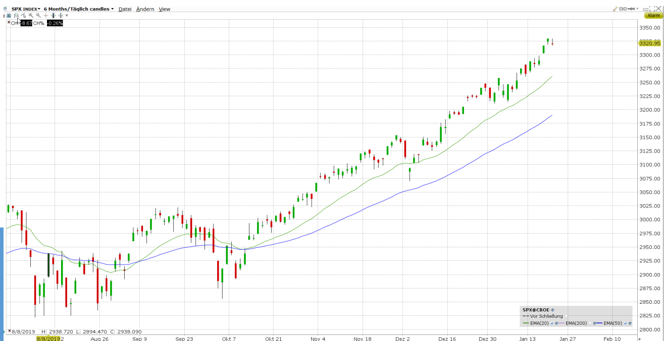
Chart: S&P500 Kurs: 3320,95 Datum: 21.01.2020